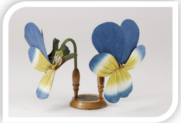
Amor-perfeito, ou outra flor (BOT.00872)